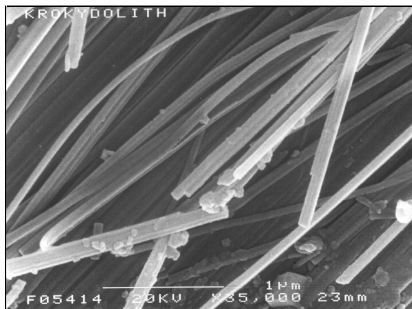
Krokydolith im Rasterelektronenmikroskop (Bildbreite ca. 3 Mikrometer)